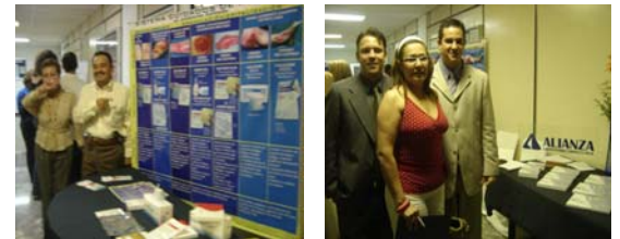
Ejecutivos de las Casas Comerciales, estuvieron presentes en el evento.

Expresamos nuestro agradecimiento a la empresa Corporación Dermoestética que siempre nos ha demostrado su incondicional apoyo en las actividades pautadas por la Sociedad. Asimismo a las Casas Comerciales Humany Care, C.A., Gs Pharmaceuticals, el que hayan hecho posible un agradable Coffee Break en ese día.