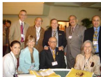
Colegas Cirujanos Plásticos

Exhortamos a todas las regiones de nuestro país, a continuar organizando este tipo de Jornadas que son de tanta importancia para la Cirugía Plástica Venezolana.